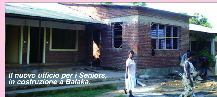
Il nuovo ufficio per i Seniors, in costruzione a Balaka.

L'Adozione ha certamente cambiato una vita.